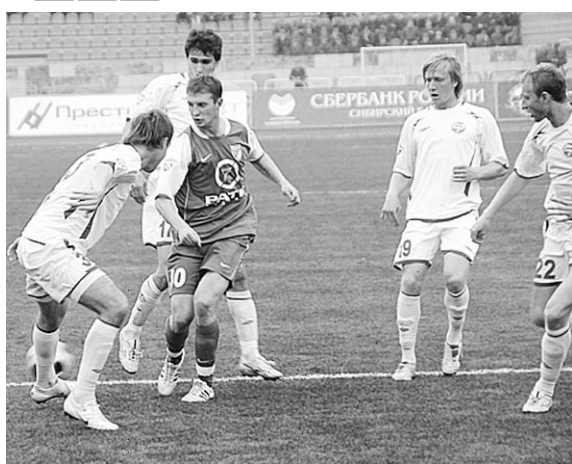
«Сибирь» — «Черноморец».

После такой уверенной победы над одним из конкурентов за выход в премьер-лигу болельщики надеялись на «продолжение банкета» в игре со скромным «Черно-