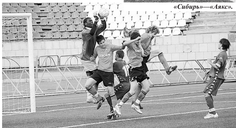
«Сельта» — «Олимпик». Атакуют испанцы.

И грянул бой! Все матчи были наполнены настоящей борьбой, хитрыми финтами нападающих, жесткими схватками защитников и самоотверженными прыжками вратарей. Игры никого не оставляли равнодушными, неслучайно аплодисментами по окончании матчей награждали поровну — и победителей, и проигравших.