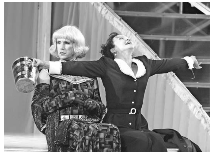
Сцена из спектакля «Примадонны».

«смешные любви», «Банкрот» по пьесе Островского «Свои люди — сочтемся», «Очень простую историю» и «Люкс № 13» (эти названия пересекаются с репертуаром «Старого дома»), а также комедию «Шут Балакирев» и сказку «Щелкунчик».