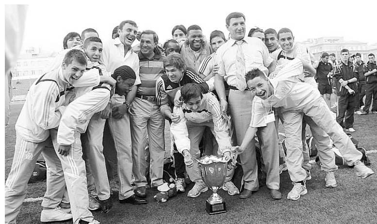
Счастливые победители с организаторами турнира.

В первом матче турнира прошлого года обладатели трофея — футболисты «Сельты» — одолели амстердамский «Аякс», подтвердив статус ниспровергателя авторитетов. Во второй игре хозяев с «Олим-