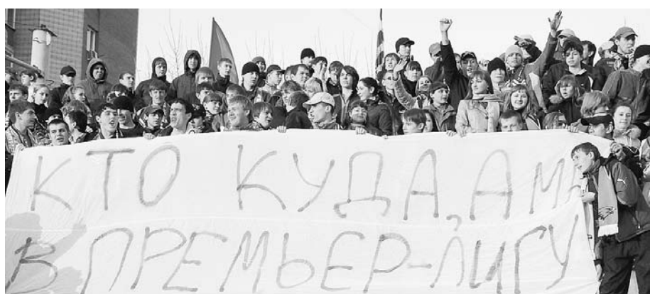
«Сибирь» — «Кубань». В этом матче банер болельщиков выглядел актуальным.