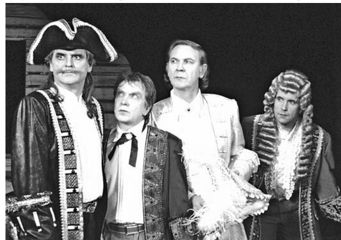
Сцена из спектакля «Шут Балакирев».

В ответ наши соседи привезут недавние премьеры и «настоянные» спектакли: «Поминальную молитву» об истории одной семьи в дореволюционной России, «Примадонны», спектакль с подстрочником